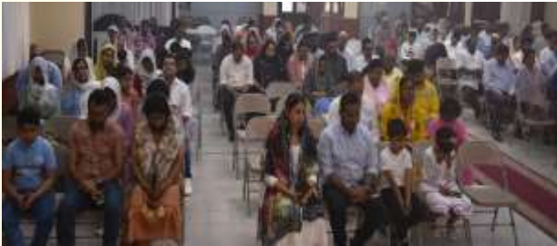
Family Dedication Day